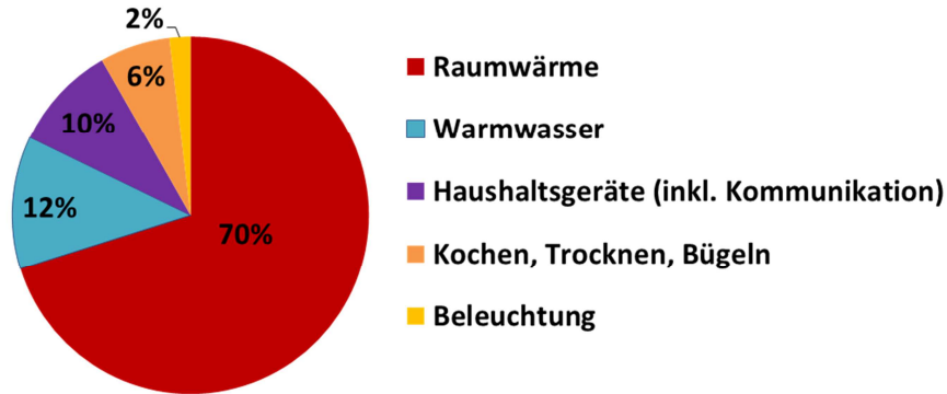
Abbildung 1: Energieverbrauch der privaten Haushalte 2011

In privaten Haushalten entfallen etwa 82% der benötigten Energie auf die Erzeugung von Wärme: 70% für Raumwärme, 12% für Warmwasser (www.statista.com, Daten für 2011). Durch bewusstes Verhalten, den richtigen Umgang mit der Heizungsanlage und sinnvolle Sanierungsmaßnahmen können Sie viel Energie einsparen. Klimaschutz fängt zu Hause an!