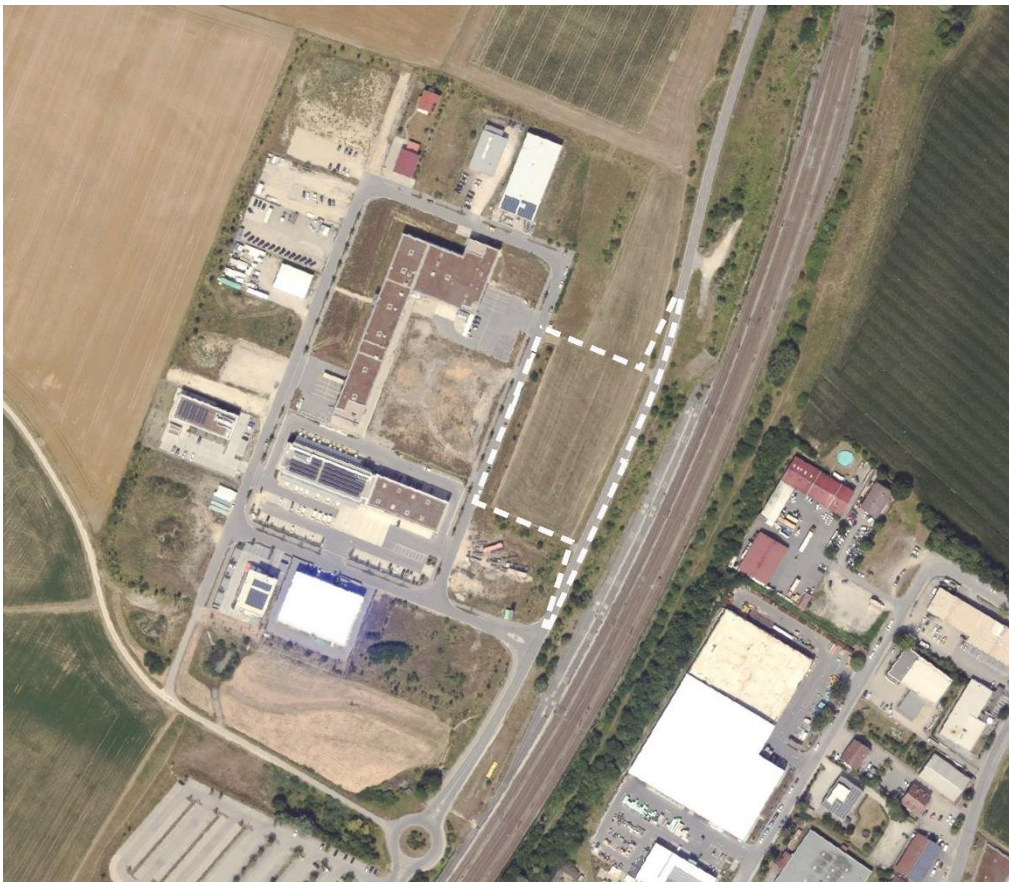
Abb. 3: Lage Geltungsbereich des Bebauungsplans, weiß umrandet, unmaßstäblich

Das Gewerbegebiet Eheäcker liegt am nördlichen Ortsrand von Petershausen. Im Norden, Westen und Südwesten grenzen landwirtschaftlich genutzte Flächen an. An der südöstlichen Grenze schließt ein vorhandenes Regenrückhaltebecken an, und südlich davon verläuft ein Feldweg, an den ein Park and Ride-Parkplatz angrenzt. Östlich des bestehenden Gewerbegebiets ist die Erweiterungsfäche geplant. Hierbei wird eine kleine Teilfläche des Gewerbegebiets überplant um die Baugrenze im Quartier Süd nahtlos vergrößern zu können.